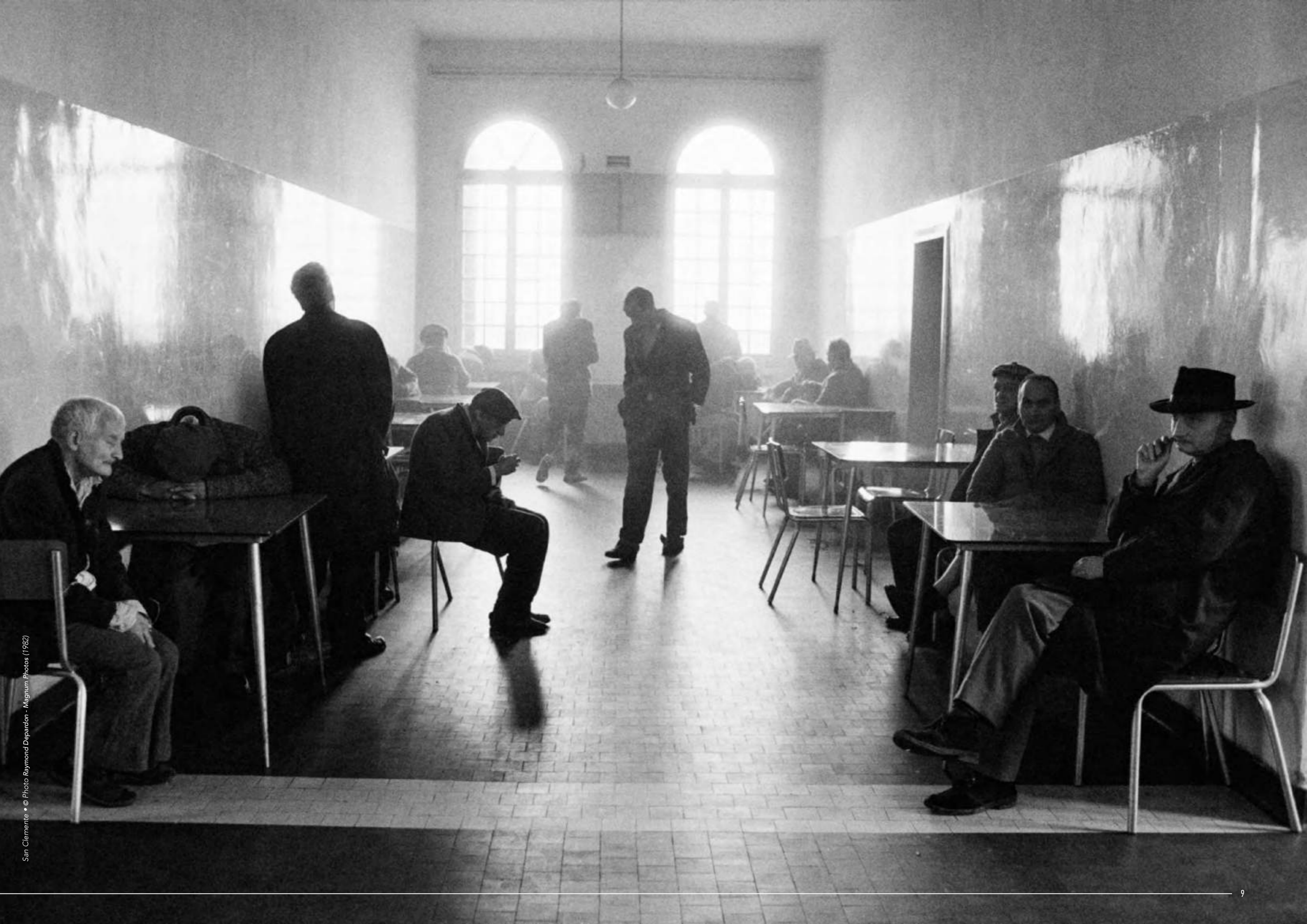
San Clemente • © Photo Raymond Depardon - Magnum Photos (1982)