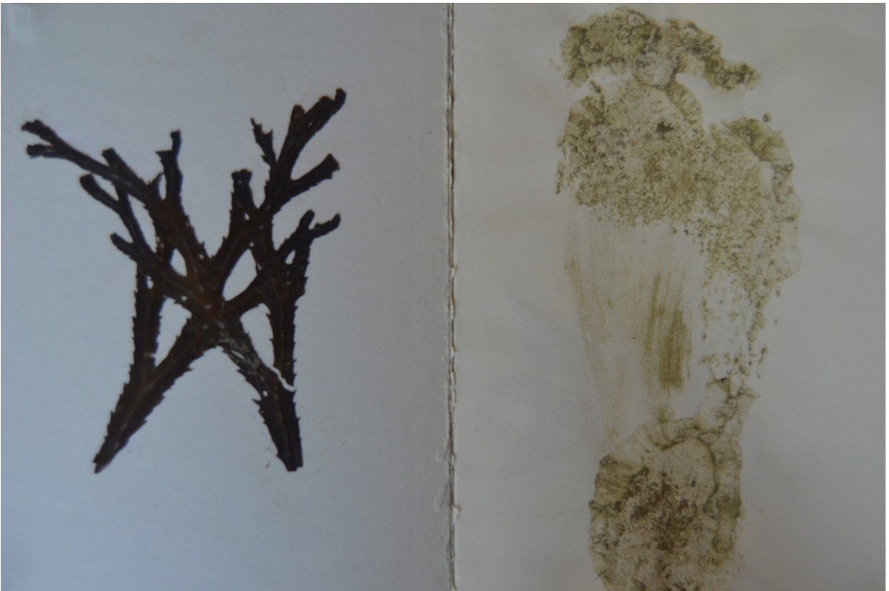
Carte de Loire échelle de 120 cm x 800 cm